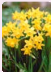
'Tete-a-Tete' 35 Stk.