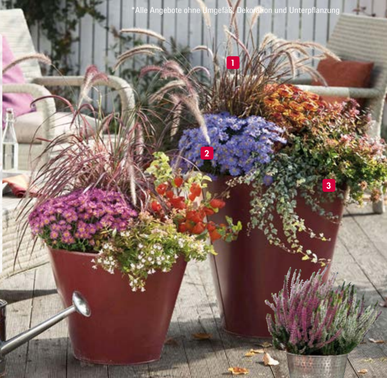
Große Sommerheide (Calluna) im 3-Farbenmix, ab 1,99 €*