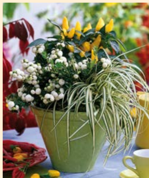
Naschzipfel – essbarer Minipaprika mit Zierwert und Geschmack Hier kombiniert mit Torfmyrthe und Carexgras, nur 2,59 €*