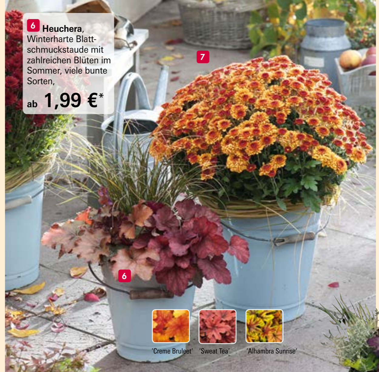
'Creme Bruleet' 'Sweet Tea' 'Alhambra Sunrise'