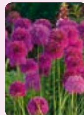
Allium 12 Stk.

Viele Zwiebeln – kleiner Preis, je Beutel nur 2,99 €