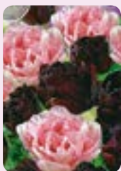
'Double Dutch' 10 Stk.

Gefüllt blühende Tulpen, je Beutel nur 2,99 €