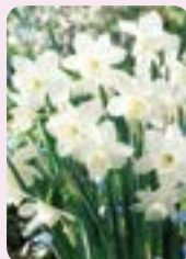
'Thalia', 30 Stk.