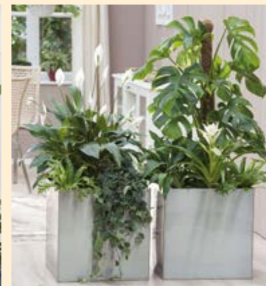
Verschiedene Akzentpflanzen 80–100 cm hoch, ähnl. Abb. ab 12,99 €*