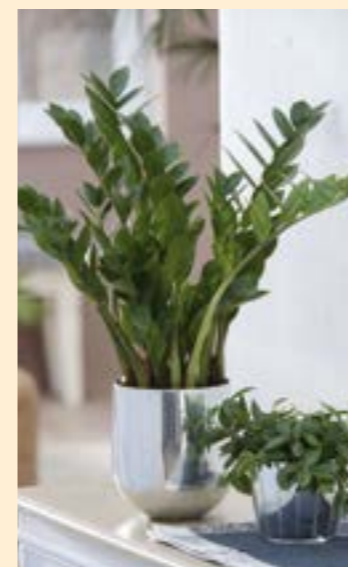
Glücksfeder (Zamioculcas) ca. 50 cm hoch, nur 9,99 €*

Wenn der Sommer zu Ende geht, ist es Zeit auch drinnen wieder mit frischem Grün für natürliche Atmosphäre zu sorgen. Zimmerpflanzen helfen außerdem die Luft zu verbessern.