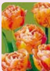
'Orange Princess' 10 Stk.